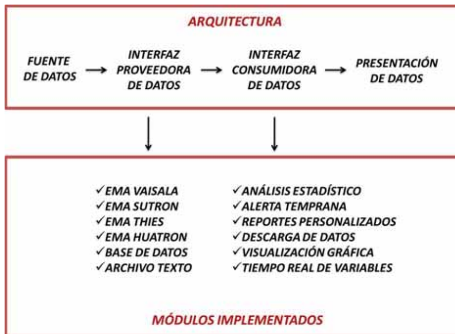
DIAGRAMA 2 ARQUITECTURA Y MÓDULOS DEL SISMAT IMPLEMENTADOS