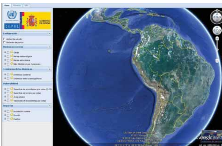
DIAGRAMA 5 VISOR DEL PROYECTO AMÉRICA LATINA Y EL CARIBE