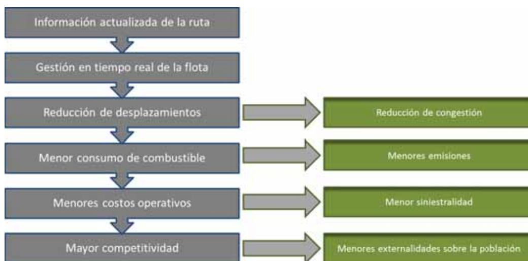
DIAGRAMA 1 BENEFICIOS DE LOS SISTEMAS ITS