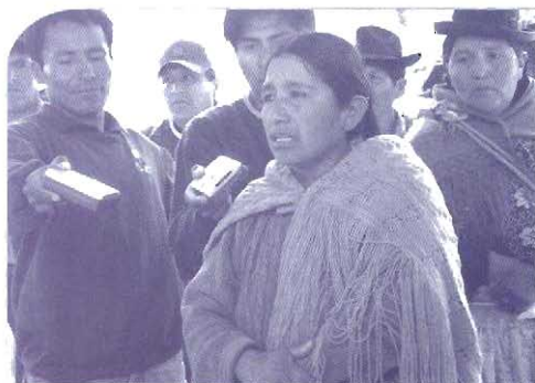
■ Un compromiso con el pueblo