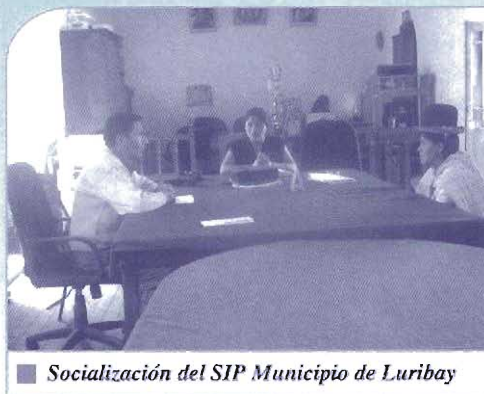
■ Socialización del SIP Municipio de Luribay

Su objetivo es digitalizar información de proyectos de gestiones pasadas y de la actual gestión, conforme a los requerimientos de la Ley 1178; a razón de administrar información gerencial para la toma de decisiones en planificación, rendición de cuentas y transición transparente. Su meta es generar mayor credibilidad y corresponsabilidad institucional en la relación mandantes y mandatarios. Ejecución del Sistema de Información de Proyectos -SIP, en los municipios de Pazña y Caracollo en Oruro; Pucarani y Chulumani en La Paz.