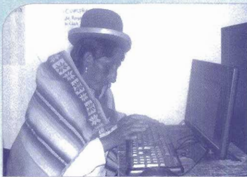
■ Capacitación ofimática líderes Caracollo

Su objetivo es fortalecer el conocimiento y habilidades de liderazgo y gestión de negocios de mujeres indígena/originarias y campesinas del Municipio, orientados al equilibrio social y económico para el VIVIR BIEN. Proyecto en desarrollo en el municipio de Caracollo.