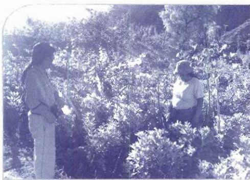
■ Producción Peña Colorada - Luribay