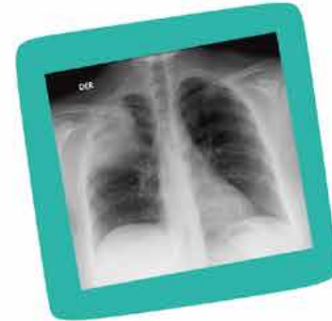
NEUMONÍA A REPETICIÓN