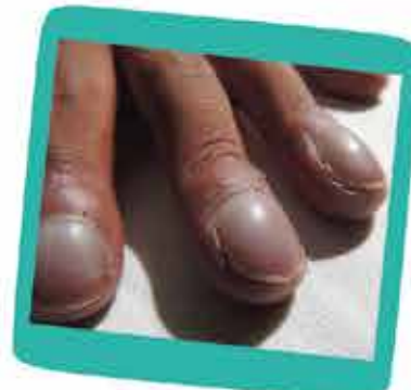
DEDOS EN PALILLO DE TAMBOR