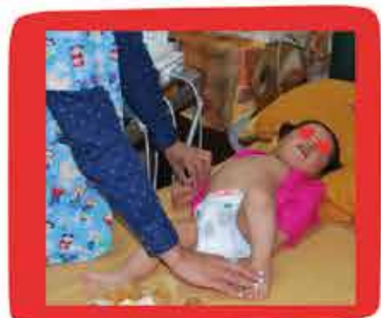
PULSOS DÉBILES O AUSENTES EN EXTREMIDADES INFERIORES