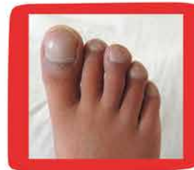
UÑAS EN VIDRIO DE RELOJ