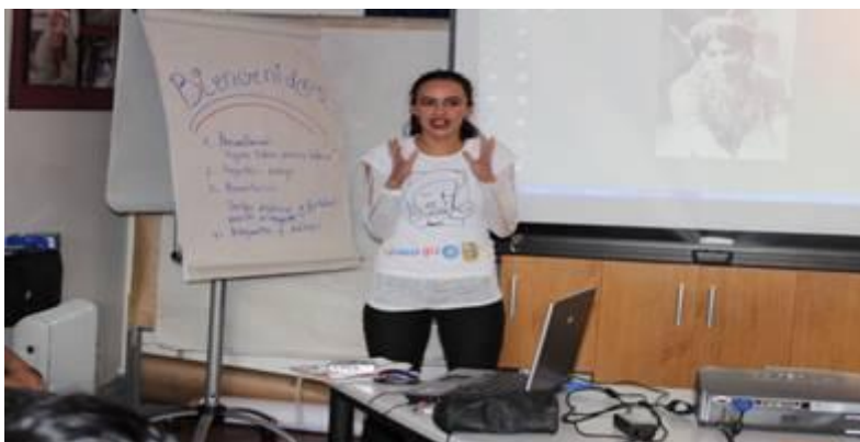
Fotos: 1) La responsable de Género de la Chiquitanía informando sobre el proyecto ganador.

Un total de 65 proyectos en torno a mujeres fortalecidas para incidir en la promoción y defensa de sus derechos fueron presentados al concurso.