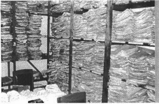
Expedientes de personal desordenados. De esta manera, es fácil ocultar irregularidades en el pago de salarios, incluso pagar salarios a personas que no existen. Esta situación fomenta el problema de los cargos ficticios.

A nivel individual, los registros y catastros garantizan el reconocimiento del individuo por parte de la sociedad ya que permiten, por ejemplo, emitir certificados de nacimiento, certificados de nacionalidad, permisos de residencia, permisos de trabajo o documentos de identidad. Los registros electorales permiten tomar parte en las votaciones y elecciones y facilitan la participación en la vida pública. Los registros de la propiedad garantizan el derecho a la propiedad