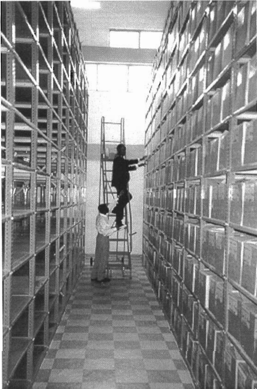
Esta gestión de documentos permite un acceso rápido y pleno a la información