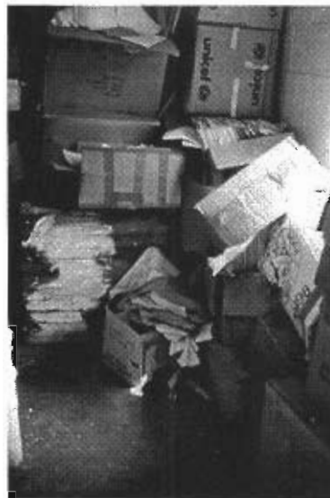
Expedientes desordenados de pacientes en hospitales. El personal de atención médica no tiene conocimiento de los tratamientos anteriores, los pacientes no reciben el tratamiento médico necesario, los análisis médicos se tienen que repetir.

[Dictionnaire de terminologie archivistique, Munich; New York; Londres; París; Saur: 1984 (Consejo Internacional de Archivos; handbooks series; Vol. 3)]