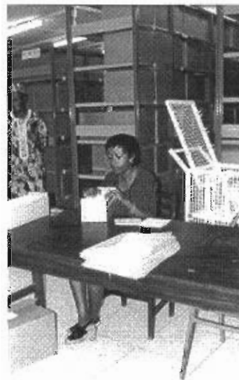
Expedientes de pacientes administrados profesionalmente y

Con la independencia, muchos países en desarrollo adoptaron sistemas de archivos heredados del sistema colonial. Al mismo tiempo, se esforzaron por preservar la tradición oral. En esta labor contaron con el apoyo de organizaciones como la UNESCO o el Consejo Internacional de Archivos, apoyo que sigue prestando la comunidad internacional de archivistas porque son precisamente los países en desarrollo los que necesitan sistemas de archivos funcionales para todos los soportes de datos y modos de registro.