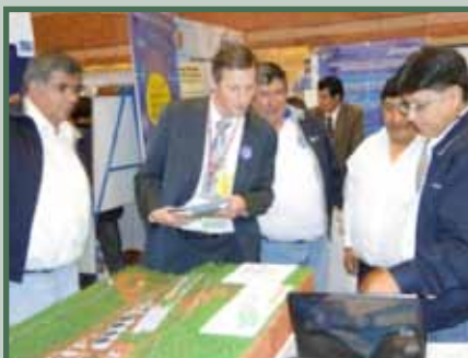
ELAPAS en la Feria del Agua del PROAPAC (La Paz)

A dos años de esta intervención, es posible afirmar que se han desarrollado capacidades en varias dimensiones. El talento humano de ELAPAS está fortalecido; los procesos, estructura, sistemas y normas han sido encaminados a una mejora continua; la gestión del entorno ha cobrado la importancia necesaria para asegurar recursos, aumentar la base de apoyo y mejorar la imagen institucional. En síntesis, ELAPAS ha sentado las bases de su sostenibilidad.