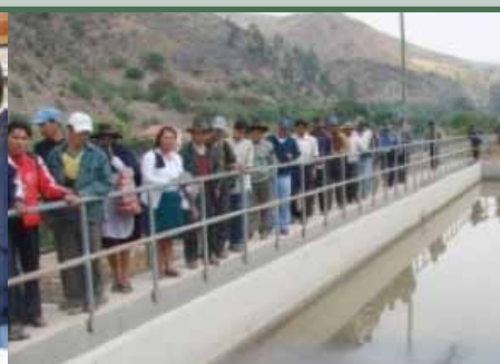
Planta de Tratamiento de Agua Residual, ELAPAS-Sucre