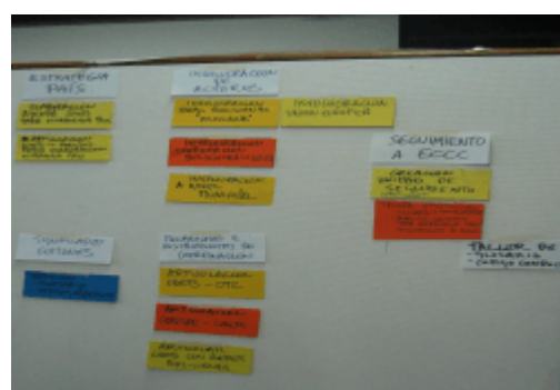
Panel de Comisiones y Contenidos

Una vez constituidas las comisiones se pidió a los participantes que se comprometieran en ellas de forma individual, aunque los miembros de la COEB decidieron comprometerse como colectivo. Se pasó posteriormente a determinar y calendarizar el plan de acción de estas comisiones, teniendo como hito final la celebración de un nuevo taller de seguimiento de la ECCC a ser posible a realizar a mediados de este año (junio o julio de 2005)