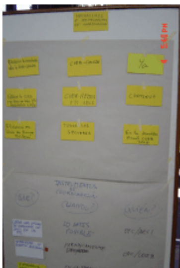
Panel de propuestas de futuro

El objetivo principal de este último día era hacer operativas todas las cuestiones que fueron surgiendo los días anteriores y proponer, así como priorizar, acciones que permitieran avanzar en la Estrategia. Para ello se dividió a los asistentes del taller en cuatro grupos de trabajo. Cada grupo tenía que analizar, de forma simultanea, los temas emergentes que habían sido detectados el día anterior. Estos temas, que marcarían el desarrollo de las propuestas de acción y por lo tanto de las perspectivas de futuro eran los siguientes: