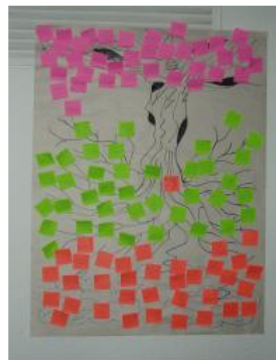
Árbol de expectativas, temores y compromisos (primer día)

Se trata de una dinámica de introducción al taller que pretende visualizar el punto de partida individual y grupal: qué espera del taller cada participante (expectativas), cuáles son los temores, las dudas con las que está participando y por último, a que se compromete cada uno/a para alcanzar su expectativa. Esta dinámica permitió realizar una radiografía inicial y sirvió para la facilitación del taller como indicador de la evolución de los participantes y del grupo en general.