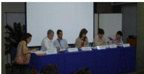
Panel de la Cooperación Española en Bolivia

Este primer día se centró en el Análisis de la Cooperación Española en Bolivia desde dos perspectivas. La primera, a través de un panel de exposición, de carácter más institucional y enmarcado en el nuevo Plan Director de la Cooperación Española 2005-08 la segunda a través del análisis reflexivo de todos