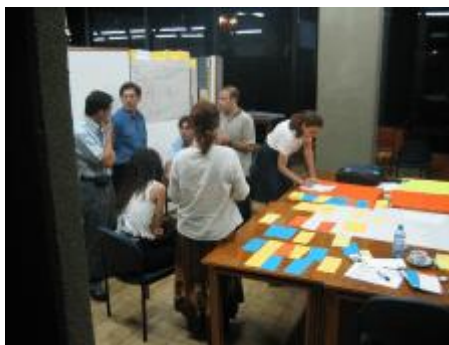
El equipo facilitador y la Comisión ad hoc, reunida agrupando los temas por bloques temáticos

Para terminar la sesión se realizó una dinámica de confianza mediante la cual cada actor determino un único tema que consideraba emergente del proceso de taller. Tras la sesión del día y la correspondiente evaluación, el equipo facilitador agrupo estos temas por bloques para el trabajo propositivo del ultimo día.