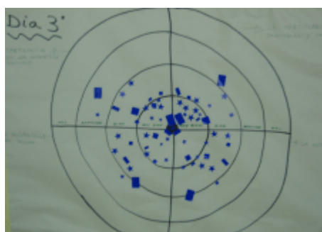
Diana del último día

Los resultados de la evaluación pueden comentarse siguiendo distintos criterios: entre los distintos componentes evaluados de un mismo día, la evolución de un mismo componente a lo largo de los 3 días o la evolución global de la valoración del taller. Es interesante observar que los resultados cambian en todas estas dimensiones, lo que refleja una evaluación concienzuda y reflexionada por parte de los participantes, que no valoraban en bloque los distintos componentes del taller, sino que con sus valoraciones iban reflejando los vaivenes de las distintas partes del mismo. El siguiente cuadro refleja estos resultados, señalando los participantes que opta por cada categoría, el número total de personas que evalúan cada aspecto en cada uno de los días y la valoración media que recibe cada uno de estos.