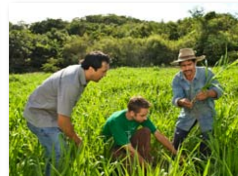
Asesoramiento a agricultores en Monteagudo.

Todas estas experiencias de trabajo del DED con la gente han sido recopiladas en una edición especial de aniversario, en una revista titulada 40 años del DED en Bolivia . Su distribución es gratuita y esta disponible en las oficinas del DED, Plaza Humboldt No. 22, Calacoto, La Paz, Tel. 2-2786438, ded@dedbol.org