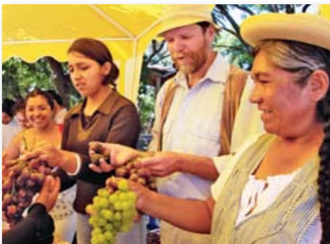
62 toneladas de uvas fueron producidas el 2005.