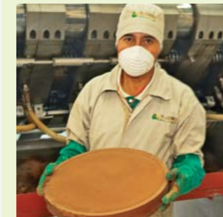
La mantequilla de cacao es un derivado obtenido en la fábrica de chocolates El Ceibo.

Con motivo de la celebración de su cuadragésimo aniversario, el DED realizó una compilación de imágenes fotográficas que serán expuestas en el museo San Francisco, en la Plaza San Francisco N° 503, del 23 de agosto al 4 de septiembre, como una de las actividades de festejo.