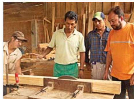
Asociación de Carpinteros de Rurrenabaque, Beni.

Paralelamente a esta actividad, el DED, desarrolla programas especiales con financiamiento adicional del gobierno alemán, como el Programa Especial 2015 de Lucha contra la Pobreza, el Servicio Civil para la Paz y el Programa Amazónico.