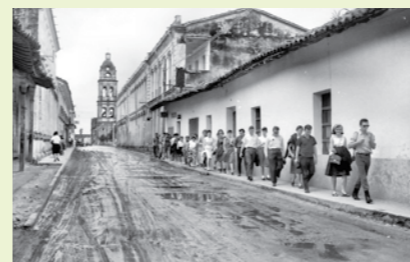
1966, primeros cooperantes llegan a Bolivia

En Rurrenabaque-Beni, el DED concentra su apoyo al fomento de organizaciones productivas y de microempresas a través de la enseñanza de conceptos empresariales. Un ejemplo de esta labor es la consolidación de la Asociación de Carpinteros de esta localidad, su mejor desenvolvimiento en el mercado, como la exposición y venta en ferias internas y la diversificación de su producción.