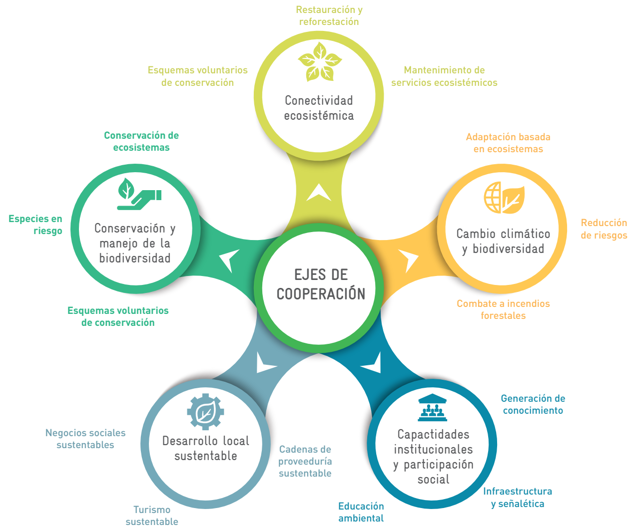
Figura 1: Ejes de conservación en ANP

Así, a través de estos ejes, las acciones se implementan de acuerdo con las necesidades y desafíos presentes en cada ANP. Estas acciones pueden