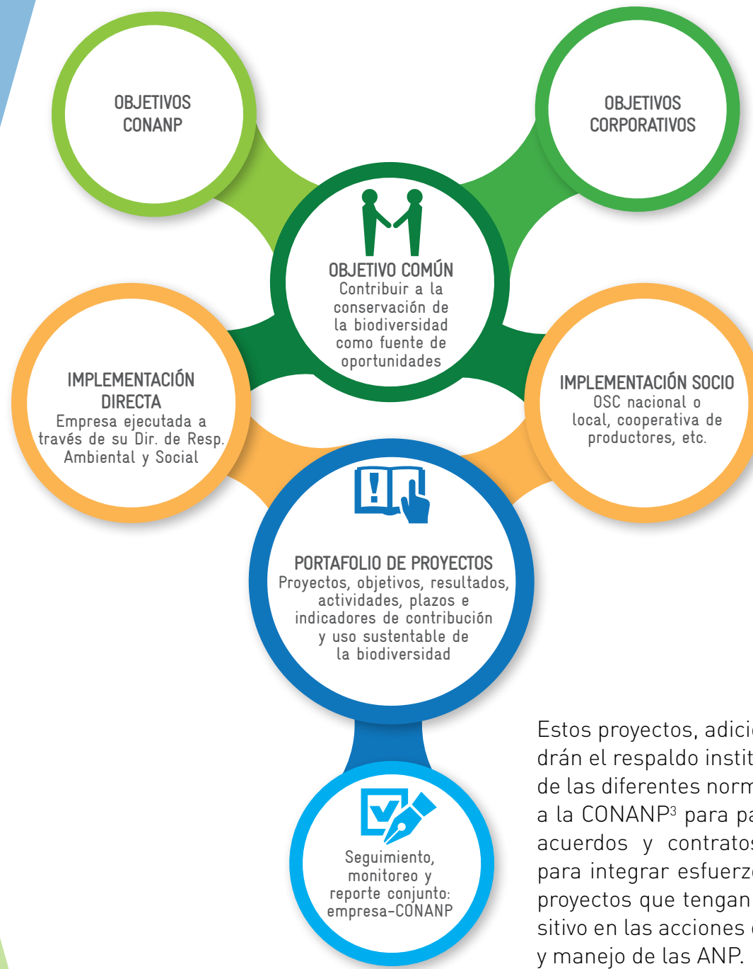
FIGURA 2: Modalidades de cooperación público-privada

Estos proyectos, adicionalmente, tendrán el respaldo institucional a través de las diferentes normas que facultan a la CONANP 3 para pactar convenios, acuerdos y contratos de donación, para integrar esfuerzos y desarrollar proyectos que tengan un impacto positivo en las acciones de conservación y manejo de las ANP.