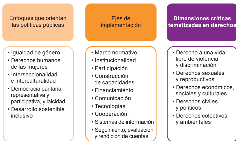
Diagrama II.1 Tres categorías de acuerdos identificables en la Agenda Regional de Género