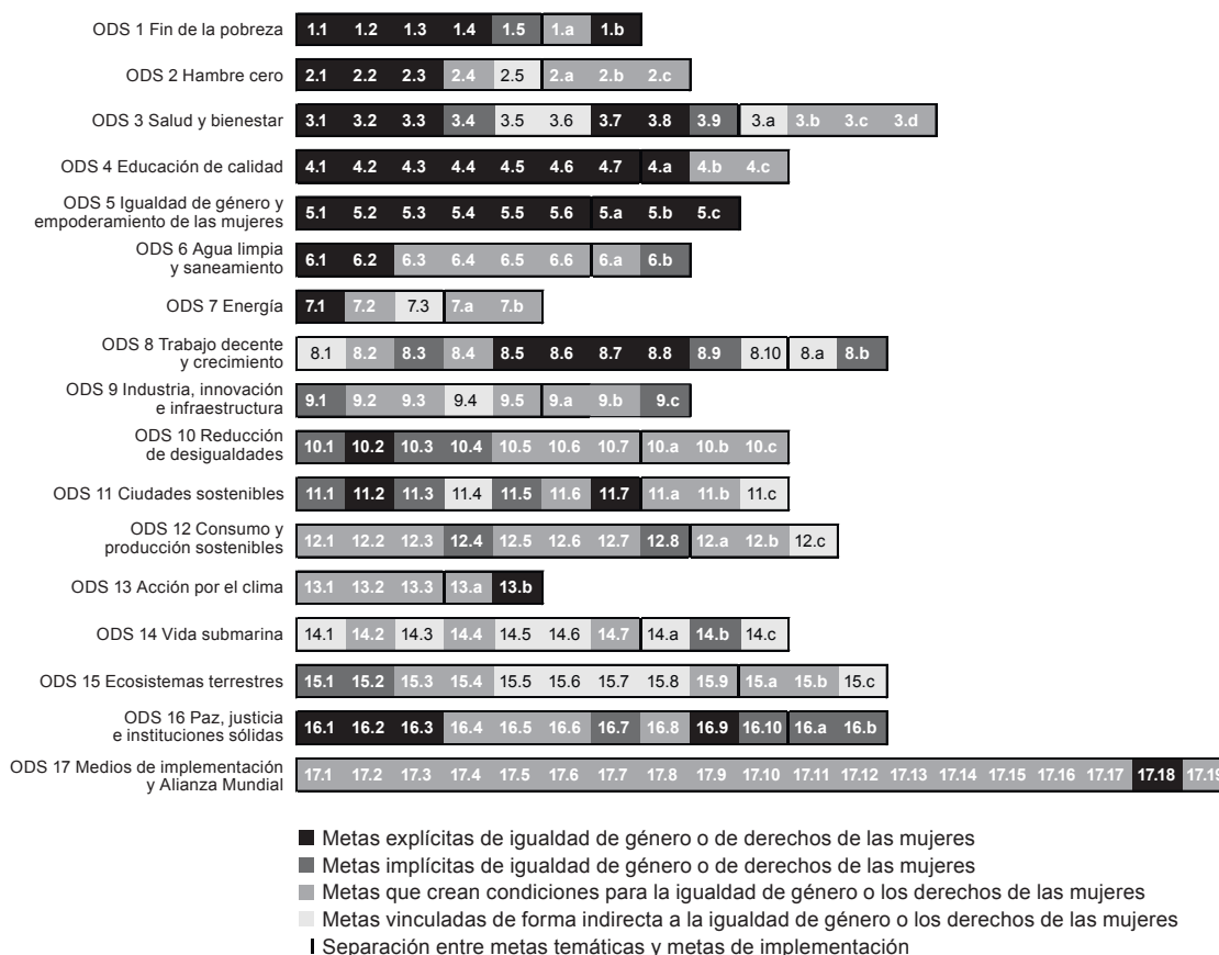
Gráfico I.1 Propuesta de transversalización de las metas de los ODS según el lenguaje acordado en la Agenda 2030 para el Desarrollo Sostenible